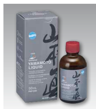
Yamamoto Liquid 50 мл, с пипеткой Номер P1695