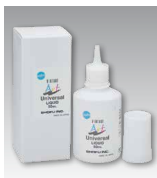
Vintage Art Universal Liquid 50 мл - Номер P0695