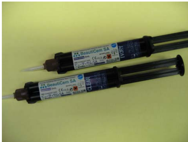
(1) BeautiCem SA в шприце с двойной камерой с насадкой для автоматического смешивания.

3 минуты в резинообразной консистенции удобным образом, «куском».