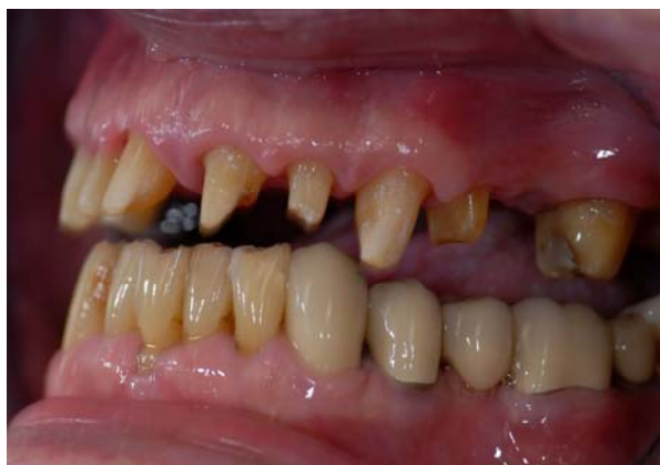
(5) Законченное препарирование перед подготовкой к слепку (снимок с зеркалом)

Чтобы без необходимости не расширять многообразие сплавов в полости рта пациента (сохранившийся металлокерамический мостовидный протез с неизвестным сплавом в правой стороне нижней челюсти, имплантат 036), изготавливаются облицованные реставрации из диоксида циркония. Решение принимается тем легче, т.к. в случае 8 отдельных коронок и двух мостовидных протезов из трех элементов можно протезировать только при хорошо научно обоснованных показаниях. После отдельной примерки каркаса и генеральной примерки могут быть установлены готовые реставрации (илл. 6 и 7).