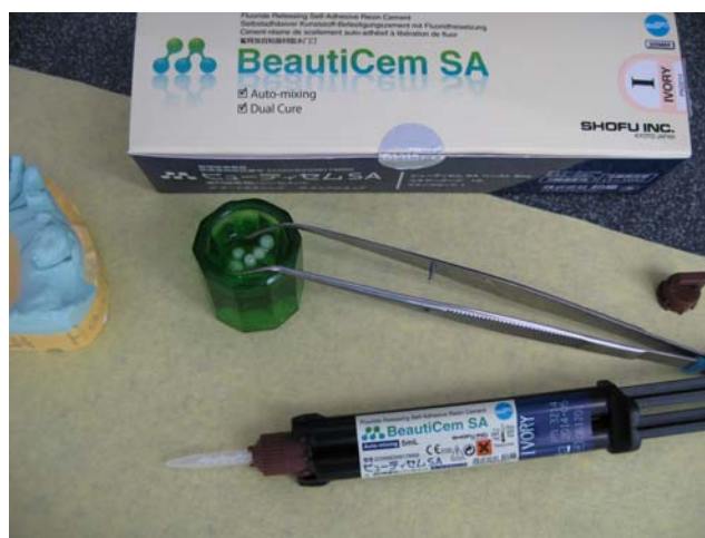
(8) BeautiCem SA ivory/слоновая кость, подготовленный к установке реставрации.

Внутренние стороны каркаса после последней примерки осторожно обрабатываются в пескоструйном аппарате порошком оксида алюминия (размер частиц 50-100 \mu\text{m} , 0.2-0.3 МПа) и чистятся пеллетой, пропитанной спиртом или ацетоном, при применении BeautiCem SA (илл. 8)