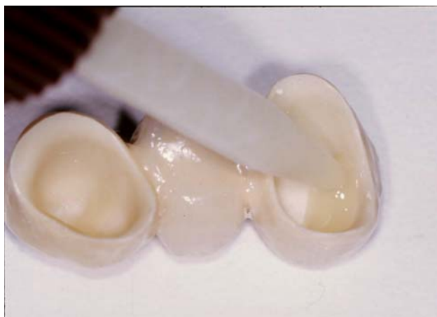
(9) Прямое нанесение BeautiCem SA в реставрацию.

самоадгезии не требуются дальнейшие этапы по кондиционированию отшлифованной твердой субстанции зуба. После сушки препарированных культей легким потоком воздуха с помощью канюли Automix непосредственно на реставрацию наносится BeautiCem SA. (илл.9) Коронки и мостовидные протезы могут быть затем установлены на опорные зубы в нужную позицию при умеренном давлении. При этом проявляются превосходные свойства текучести: при легком надавливании материал растекается, образуя минимальную толщину пленки до 11,5 \mu\text{m} , но, с другой стороны, находится в состоянии без нагрузки и не стекает в труднодоступные места при удалении излишков.