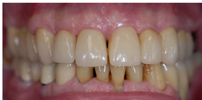
(13) Завершающая ситуация в максимальной интеркуспидации с фронтальной стороны.

Ситуация с данными по BeautiCem SA является еще не окончательной, поскольку в немецких и международных университетах еще не завершены долгосрочные исследования. Имеющиеся на сегодня результаты свидетельствуют, однако, особенно в соединении с дентином, о чрезвычайно высоких начальных показателях прочности соединения, что говорит о хороших перспективах.