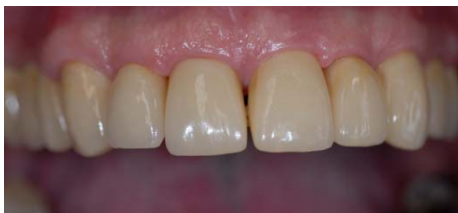
(12) Реставрация верхней челюсти сразу после установки.