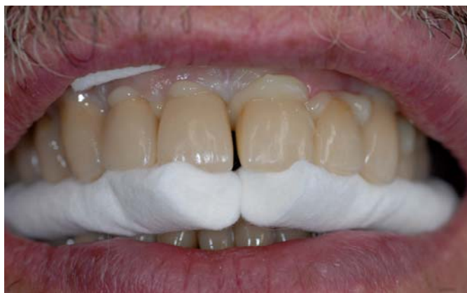
(10) Установленная и зафиксированная реставрация с излишками композита.