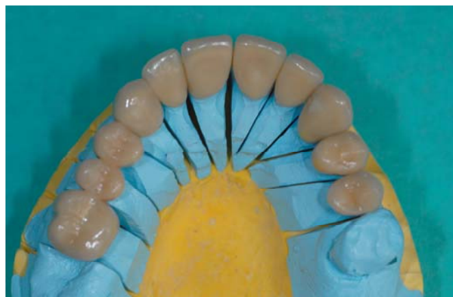
(7) Облицованная реставрация из диоксида циркония на модели верхней челюсти.

Внутренние стороны каркаса после последней примерки осторожно обрабатываются в пескоструйном аппарате порошком оксида алюминия (размер частиц 50-100 \mu\text{m} , 0.2-0.3 МПа) и чистятся пеллетой, пропитанной спиртом или ацетоном, при применении BeautiCem SA (илл. 8)