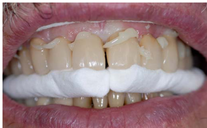
(11) Удобное удаление излишков в резинообразной консистенции.